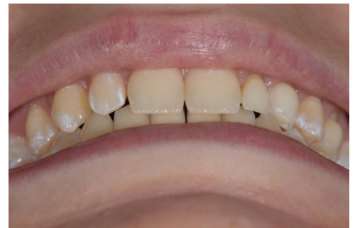
Stellung OK / UK zueinander