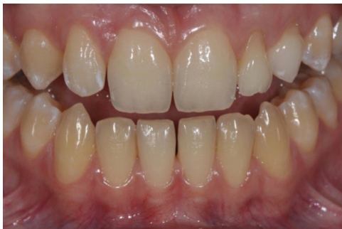
Situation mit leicht geöffneten Zahnreihen