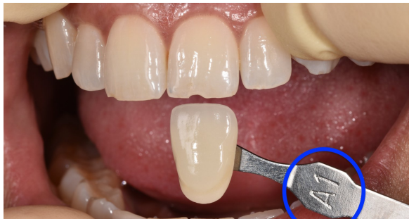
Zahnfarbe mit Zahnstäbchen (Referenz)