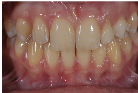
Situation in Schlussbisslage